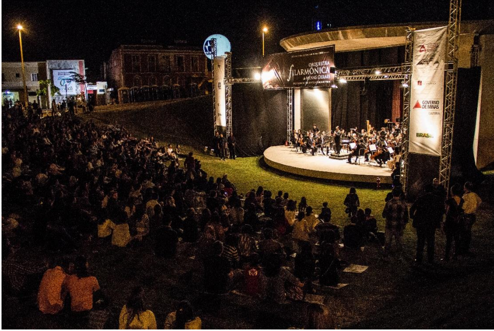
ESTRUTURA DE Q30 E Q 50 PARA ILUMINAÇÃO E SONORIZAÇÃO ARAXÁ