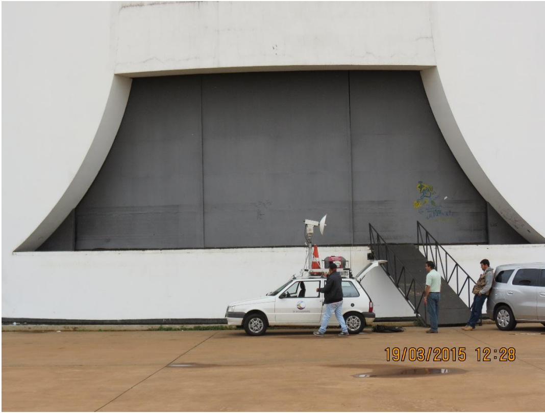
ESTRUTURA DE Q30 E Q 50 PARA ILUMINAÇÃO E SONORIZAÇÃO UBERLÂNDIA